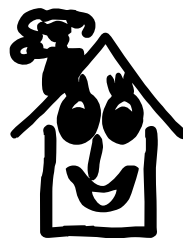
Spokojený domov, o.p.s.

Cílová skupina: senioři, handicapovaní (bez omezení věku), pečující rodina